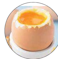
Œuf à la coque / Boiled egg 3 mn