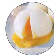
Œuf mollet / Soft-boiled egg 5 mn